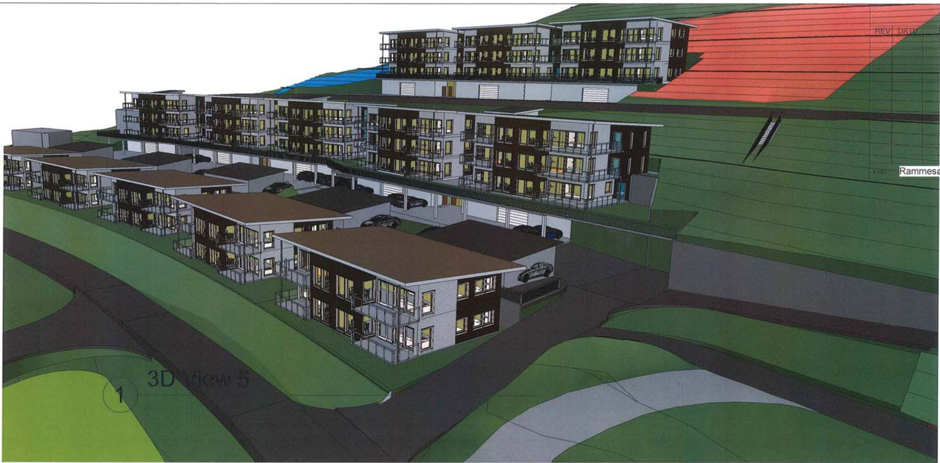
1 3D View 5