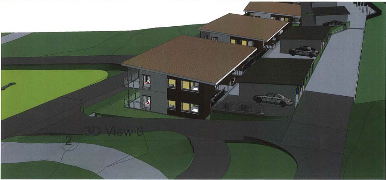
2 3D View 6